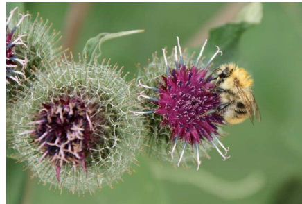
Bij op een kleine klit

Een deel van de grond is hier in handen van natuurorganisaties. De boeren krijgen een vergoeding voor natuurvriendelijker boeren.