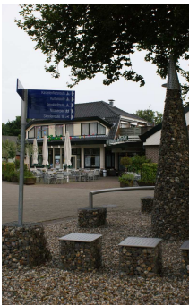
Café Ter Voert

Start: Ter Voert in Megchelen. Hier kunt u uw auto neerzetten en de fietsroute beginnen. Ook kunt u hier na afloop nog wat drinken als u wilt.