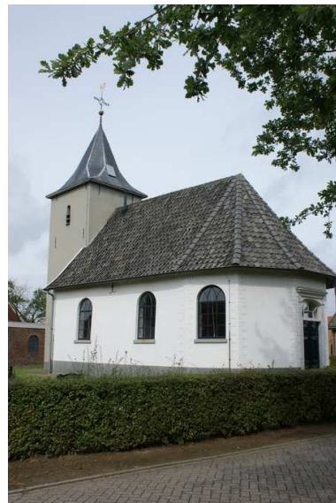
Protestants kerkje in Megchelen