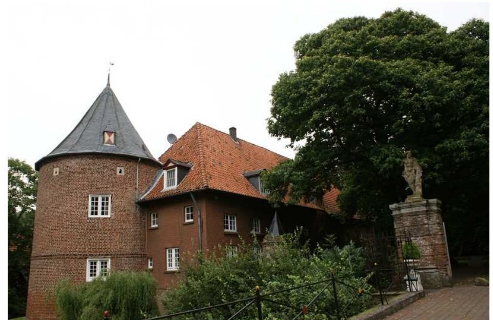
Schloss Huet heeft een luisterrijk verleden, maar is in de Tweede Wereldoorlog gebombardeerd en sindsdien gedeeltelijk hersteld

Dit kasteel heet Schloss Huet en de geschiedenis is niet ongemerkt aan dit kasteel voorbij gegaan. Aan het einde van de Tweede Wereldoorlog is het gebombardeerd en niet in de oude glorie hersteld. Het kasteel heeft wel luisterrijke perioden gekend. Het is gebouwd in 1361, mede als vluchtplaats voor mensen en vee bij hoog water. In de 17 e werd het omgebouwd tot een representatief slot. Daarna